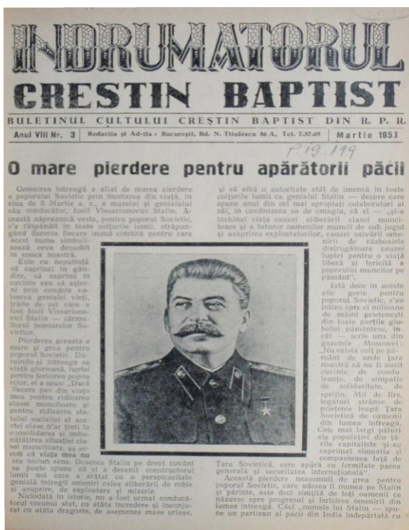
Fig. 1. „Îndrumătorul Creștin Baptist”

Astăzi putem să ne lăsăm purtați de valul judecății și să exprimăm fel și fel de teorii, care mai de care mai acuzatoare, pentru valsul acesta cu regimul, între acomodare și rezistență, dar istoricul trebuie să privească obiectiv. Analiza articolelor arată că repetarea titlului de „marele stegar al păcii”, regăsită în toate trei, ne poate face să înțelegem că a existat un text primus, pe care îl găsim în circularele C.C. al P.M.R. Apoi, dintre cele trei articole, două au ocupat prima pagină a oficioaselor, arătând importanța textului și urgența publicării lui, iar una a fost mai degrabă periferică. Dar publicarea lor este o veritabilă mostră de adaptare și de conviețuire a presei neoprotestante în regimul comunist. Niciun pastor sau conducător de cult nu și-a asumat semnarea lor, arătând, prin aceasta, originea politică a lor, impusă de sus în jos. Astăzi, publicarea unor asemenea texte ar părea total de neînțeles. De aceea, astfel de articole de presă se pot înscrie în politicile publice ale statului comunist de folosire a oricărui mijloc pentru a-și realiza idealurile și pentru a-și idealiza realizările.