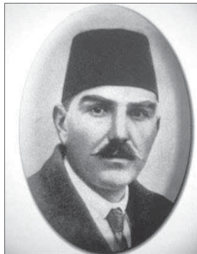
Fig. nr. 1. Portretul liderului de opoziție, Hilmi Tunalı.

Prima hutba Încercând a fi de ajutor Sfintei Națiuni Tunalı Hilmi scriitor Tipărit la Geneva 1313